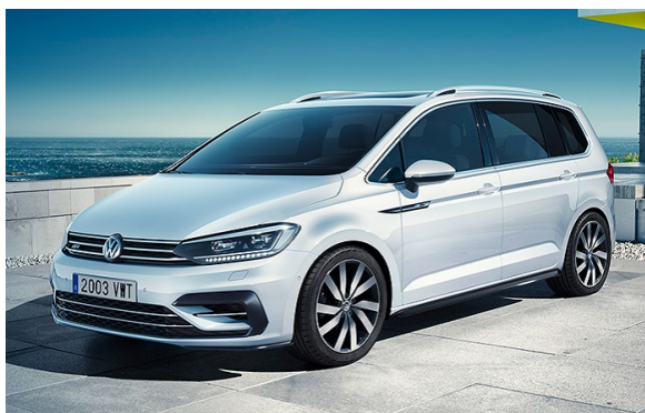
Touran desde 20.300€. Vive la aventura de ser padres, conduciendo un familiar de Volkswagen. VER OFERTA volkswagen.es/touran