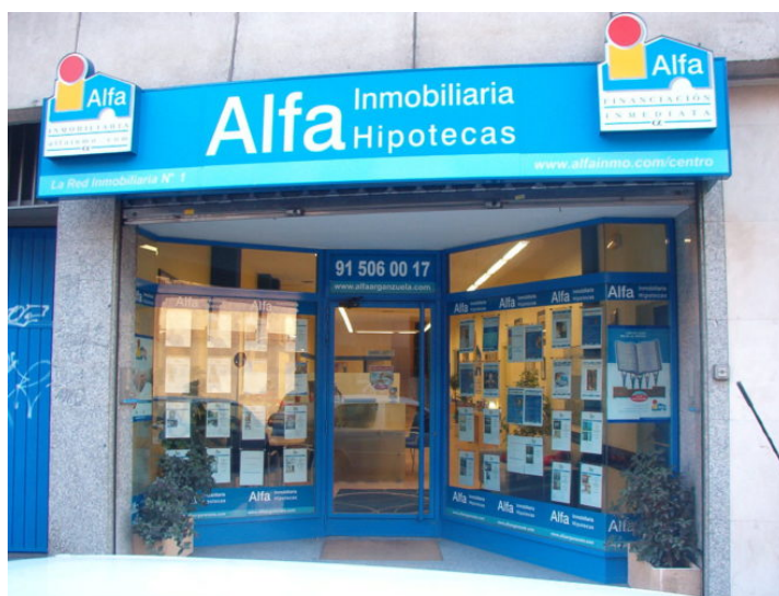
Fachada de uno de los establecimientos de la red de Alfa Inmobiliaria.