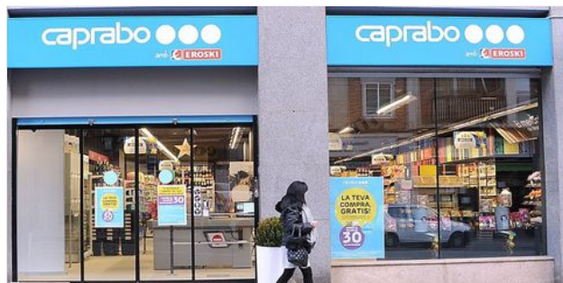
CAPRABO ABRE UN SUPERMERCADO EN SABADELL