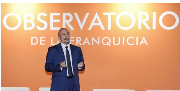
ERRORES DE LOS FRANQUICIADORES PRINCIPIANTES