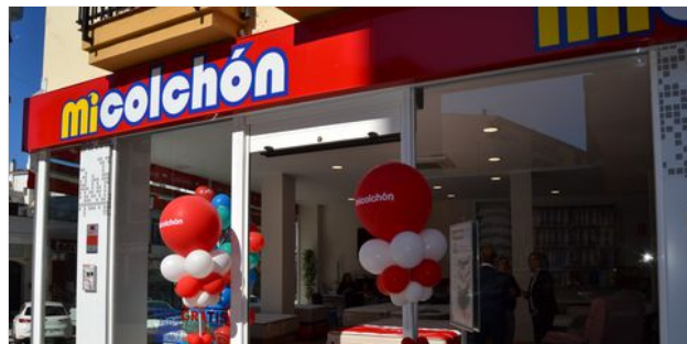
MICOLCHÓN ABRE UNA TIENDA EN MÁLAGA