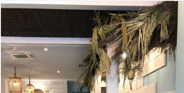
TASTY POKE BAR ABRE UN RESTAURANTE EN A CORUÑA