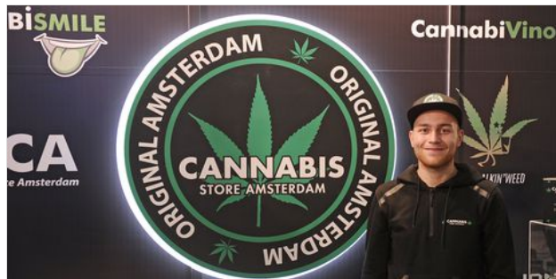
EL PROMETEDOR NEGOCIO DEL CANNABIS