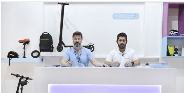
URBANITY: LA APUESTA POR LA MOVILIDAD SOSTENIBLE