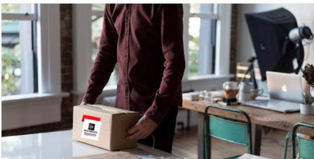
MAIL BOXES ETC. ABRE UN CENTRO EN MADRID