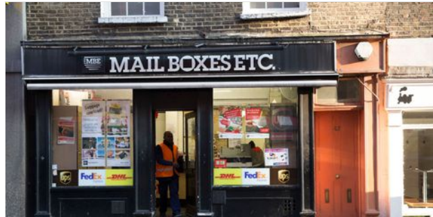
MBE WORLDWIDE PRESENTA SUS RESULTADOS