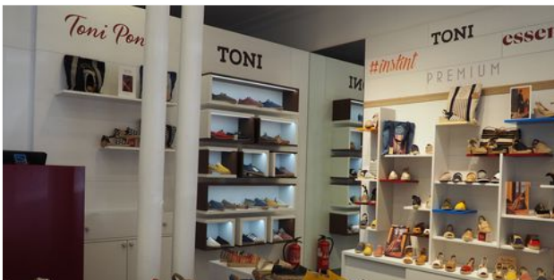
TONI PONS INAUGURA SU SEGUNDA TIENDA EN SEVILLA