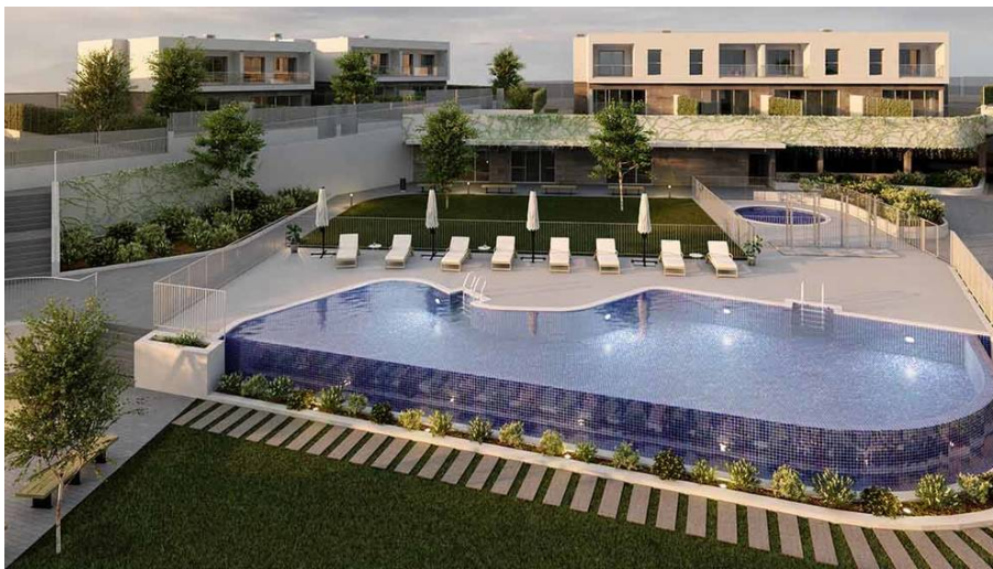
Promoción de Aedas Homes en Colmenar Viejo.

La dificultad de buena parte de la población para comprar casa y unos alquileres en máximos han provocado que la demanda se aleje cada vez más del centro de la ciudad