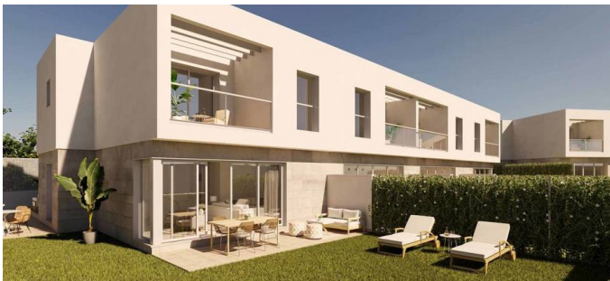
Promoción de Aedas Home.